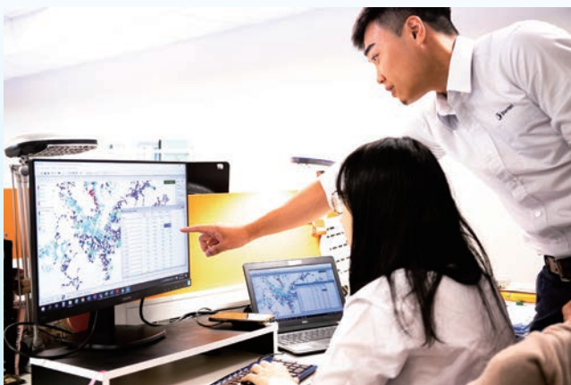
美商傑明引進國際經驗，導入多因子分析進行管線損害風險識別，並首度建置國內主要城市全管網動態水力分析模式，實現更智慧、更精準的供水管理決策支援工具。

展望未來，美商傑明將持續以台灣水資源、環境和城市改善的「隱形幕僚」自居，與客戶一起奮鬥發揮影響力，不僅成為台灣國家隊強而有力的夥伴，更要輸出台灣技術與經驗走向世界舞台，實踐「Taiwan Can Help」的遠大目標。